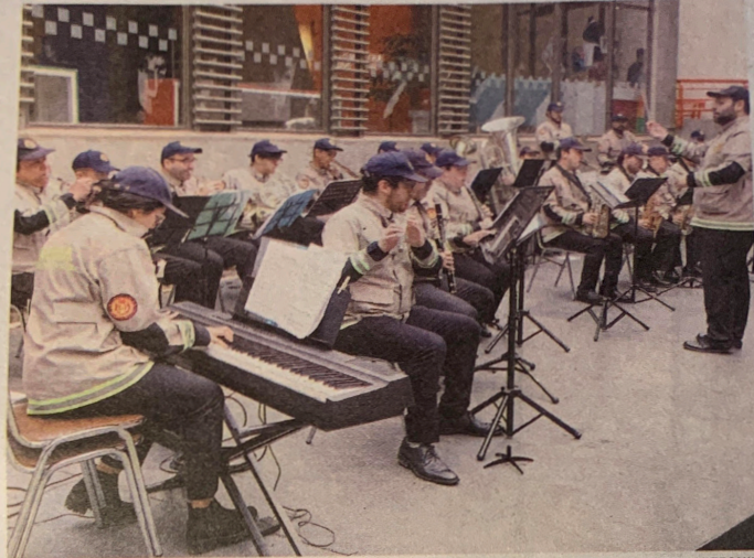
BANDA INSTITUCIONAL DEL CUERPO DE BOMBEROS ENTREGÓ AYER UN COMPLETO SHOW EN EL MUSEO ARTEQUIN.

El director contó que "esta banda nació en 2019 por la necesidad que tuvo Bomberos de tener su banda propia para la ceremonia y los funerales, y hemos podido evolucionar y conformarnos en una banda dirigida a