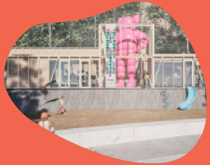
Proyección de la nueva construcción, por Yáñez Hormazábal

Además, se dio inicio a dos proyectos de infraestructura: la ampliación del museo, que busca construir un tercer edificio que albergue una sala de exposiciones temporales y oficinas, y el proyecto Camino Lúdico, que busca construir un recorrido de juegos desde la Plaza Vergara hacia el museo. En la primera etapa se financió el diseño de ambos proyectos, que fueron desarrollados por las oficinas Yáñez Hormazábal y Estudio Pedro Silva, respectivamente